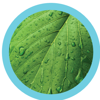
Zwykłe nawozy na bazie soli lub chelatów